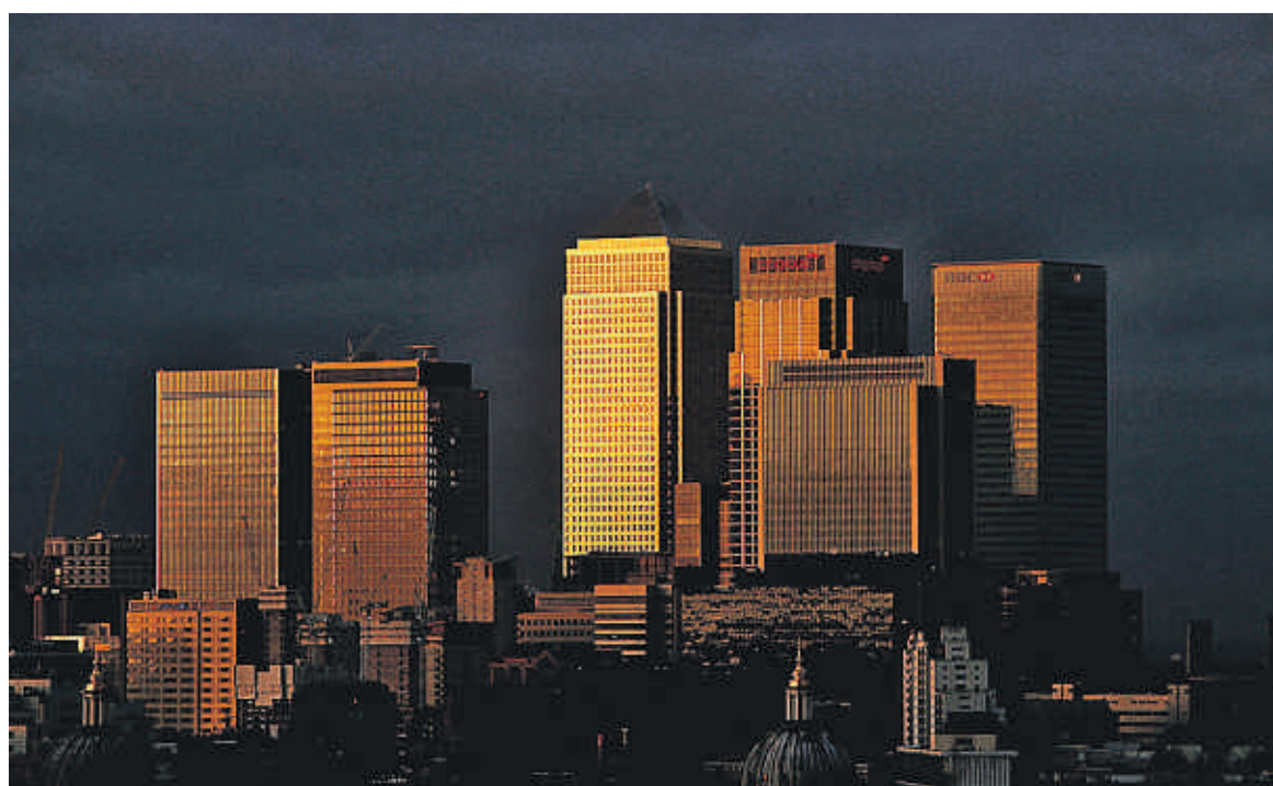
Naredo denuncia una economía fuertemente financiarizada en la que los países ricos viven del crédito de los pobres

redo ha sido larga. Él mismo las narra ahora en Luces en el laberinto , que agrupa su biografía intelectual y una entrevista de Jorge Riechmann y Óscar Carpintero sobre la crisis actual, sus causas y algunos caminos de salida.