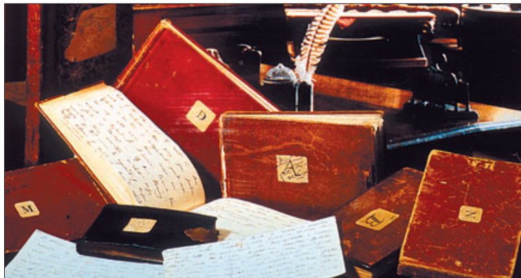
RECUERDOS DEL NATURALISTA ▶ Arriba, una caricatura de Darwin publicada en The Fun , en 1871, junto a un cuadro con 32 razas de palomas exóticas creadas a partir de la común, que le dieron una idea de lo que podía hacer la selección natural en millones de años. Abajo, cuadernos de notas originales del naturalista.

paz de unir y sintetizar sus vastos conocimientos para una entrada del Oxford Dictionary of National Biography , reconvertida ahora en este libro donde está todo lo que hay que saber sobre el científico que cambió el lugar del hombre en la naturaleza.